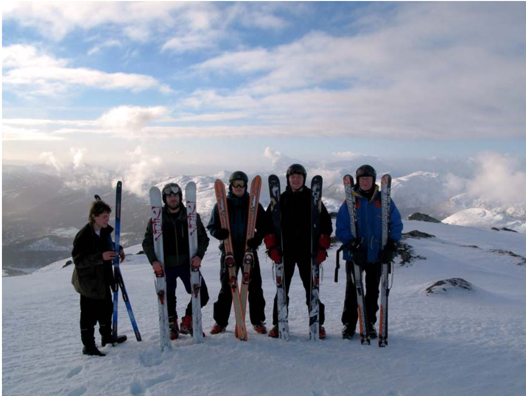
Toppturteamet frå Vassenden. Utsikt mot vest.

Nedkøyringa på austsida er rekna for ei av dei betre i Jølster.